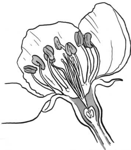
la fleur de cerisier