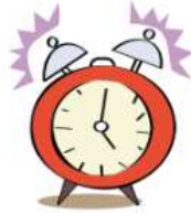
un ré veil