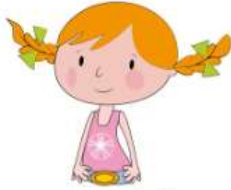
une fil le

Tu le dis et tu souffles en même temps. C'est le ill de fil le et le il de ré veil .